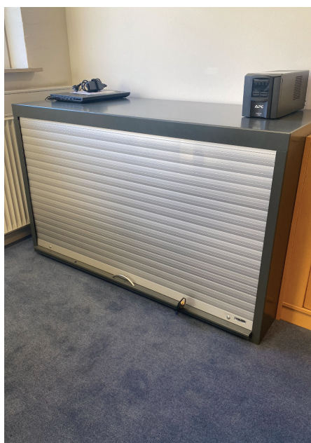
Specialskab til sikring af IT udstyr, dokumenter mv.