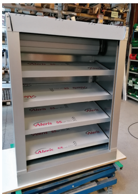
Specialskab til indbygning under betjeningsdiske